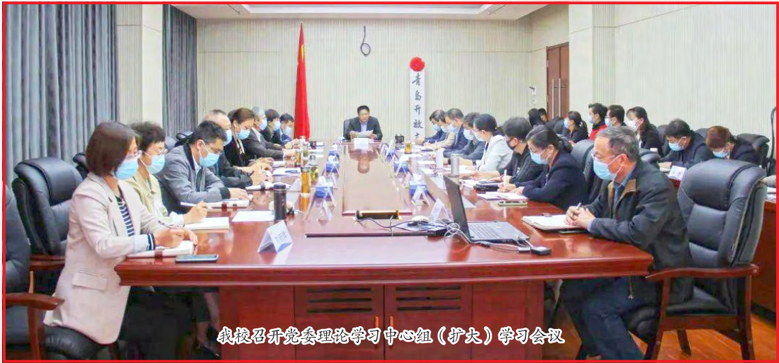
我校召开党委理论学习中心组（扩大）学习会议