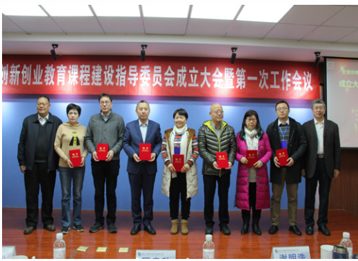
为课指委委员代表颁发聘书

来自山东大学、四川大学青岛研究院、中国海洋大学、中国石油大学、青岛科技大学等8个本科院校，上海开放大学、广州广播电视大学、山东广播电视大学等