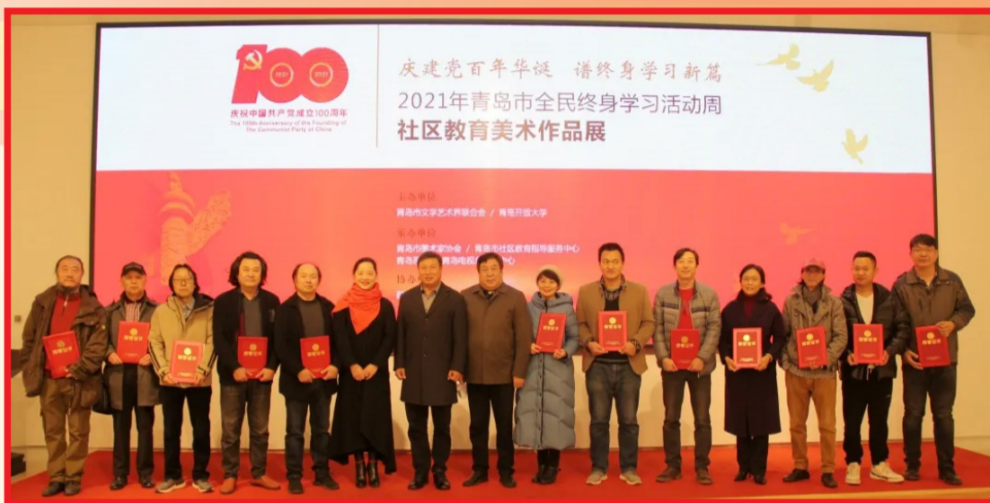
我校举办2021年青岛市全民终身学习活动周社区教育美术作品展 为入围作品代表和优秀组织奖颁发荣誉证书

精神,是当前和今后一个时期的重大政治任务。宣传部门要精心安排部署,迅速掀起学习宣传贯彻热潮。要把全会精神作为党委理论学习中心组首要议题,作为干部教育培训重中之重,坚持原原本本学、深入思考学、联系实际学。党员领导干部要先学一步、深学一层,带头学懂弄通做实,带头开展研讨交流,推动全会精神深入基层、深入人心。要抓好理论研究和理论创新,以理论创新引领学校高质量发展。