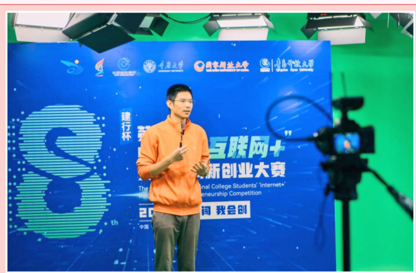
我校在第八届中国国际“互联网+”大学生创新创业大赛中勇夺两金

方法论，坚持好、运用好贯穿其中的立场观点方法。要牢牢把握坚定不移推进全面从严治党要求，持续巩固拓展良好政治生态，激励党员干部在新时代新征程中展现新担当新作为。要牢牢把握团结奋斗的时代要求，心往一处想、劲往一处使，一步一个脚印把党的二十大大作出的重大决策部署付诸行动、见诸成效。 岳国峰强调，要深刻领会对未来五年党和国家各项事业特别是教育事业的战略部署。深刻领会把握在推进中国式现代化全局中进行教育、科技、人才“三位一体”总体部署的宏观逻辑，以落实好本职工作为基点，以苦干实干的责任担当聚力推动学校高质量发展，切实把学习领会的新体会新认识转化为推动工作的新思路新举措，切实将党的二十大精神的学习贯彻转化为加快推进高质量教育体系、办好人民满意的教育的强大动力。(孙洋波)