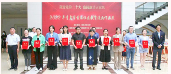
为廉洁文化宣传服务队成员颁发聘书

化宣传服务队成员，将深入社区开展廉洁文化志愿服务宣传活动，传播优秀传统文化美德，丰富清廉文化载体，打造廉洁文化宣传教育特色品牌。