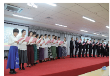
支部充分发挥党联系群众、宣传群众