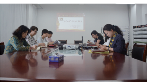
“两学一做”支部学习

第二党支部由培训部(继教学院)、资产处、新校办组成,共有党员 11 名。结合学校的发展思路,第二党支部以深度学习“两学一做”、干事创业当先锋表率,开放创新服务全民学习为指导思想,在培训教育承接举办的各级各类培训项目中,在学校资产管理和新校建设工作中,努力在学校的 3+1+1 办学模式、校园文化建设、学校发展的各个工作岗位上尽心尽力、尽职尽责,积极发挥党员模范带头作用。