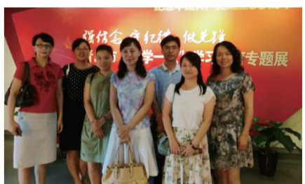
纪念中国共产党成立 95 周年,在青岛党史纪念馆参观