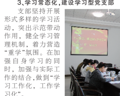
支部充分发挥党联系群众、宣传群众