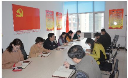
“中国共产党第十八届中央委员会第六次全体会议”专题学习