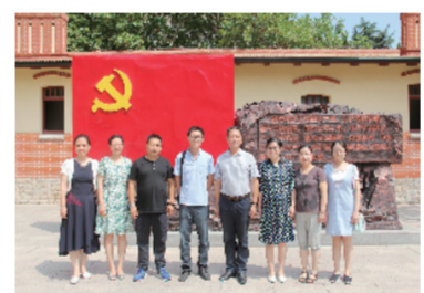
支部充分发挥党联系群众、宣传群众

第一党支部共有党员 13 名,分别来自办公室、政工处和工会三个部门。在校党委的正确领导下,第一党支部始终与党中央保持一致,切实增强党组织的创造力、凝聚力、吸引力和战斗力,不断为学校的办学发展做出自己的贡献。