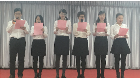
参加弘扬长征精神,继续新的征程——“纪念红军长征胜利 80 周年”主题教育活动