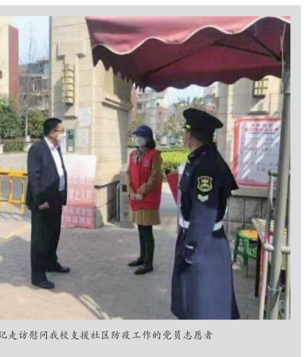
岳国峰书记走访慰问我校支援社区防疫工作的党员志愿者

座谈会上，双方交流了新冠肺炎疫情防控工作经验，共同回顾了近年来党建互联互通融合发展的相关情况，聚焦为民服务解难题党建共建情况，对照党建共建资源清单、需求清单和项目清单落实情况进行了“回头看”。 岳国峰书记指出，我校将充分发挥高校优势，积极作为，