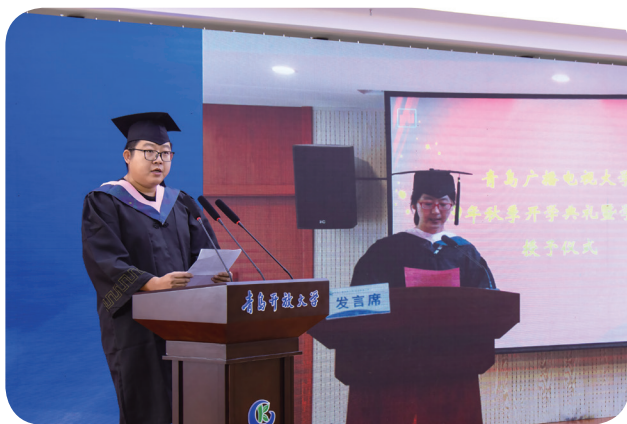
2020年毕业生代表讲述自己在青岛电大的成长

国内最早从事创业教育的大学、青岛市首批工业互联网培训承接单位……41年来，青岛广播电视大学始终砥砺前行，创造了一系列的“首个”“首批”“第一”“最早”，走出了“先进传播手段+名师名教”的发展之路，探索了开放教育的实现路径，积累了终身教育的办学经验，扛起了青岛市开放教育、创业教育、社区教育的重任，成为青岛市开展继续教育、职业技能人才培养和学习型城市打造中不可或缺的一环。