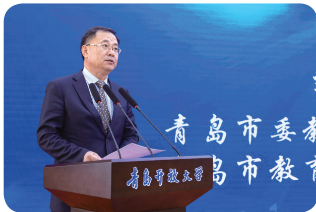
青岛市教育局局长、党组书记刘鹏照宣读《山东省人民政府关于青岛广播电视大学更名为青岛开放大学的批复》

青岛市人民政府副市长朱培吉和国家开放大学党委书记、校长荆德刚为青岛开放大学揭牌。国家开放大学副校长鞠传进、青岛