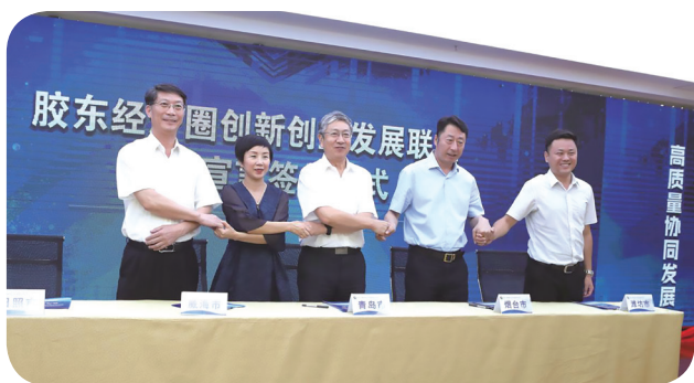
成立胶东经济圈创新创业发展联盟

2020年7月22日，青岛广播电视大学（青岛创业大学）牵头，联合烟台、潍坊、威海、日照的创业大学（创业学院）成立胶东经济圈创新创业发展联盟，构建胶东一体化创新创业发展交流与合作的“朋友圈”。还联合国内外多所知名高校、科研院所成立创业联盟，形成创新创业、教育培训的合力。