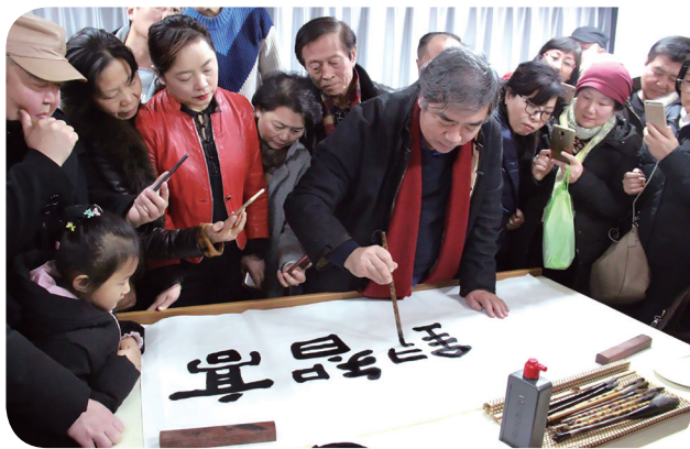
书画名师走进老年开放大学授课

近年来，学校以大连路校区为主阵地，大力发展社区教育、老年教育，成立青岛老年开放大学。七大院系、近百门的课程，更好地满足了老年人的学习需求。