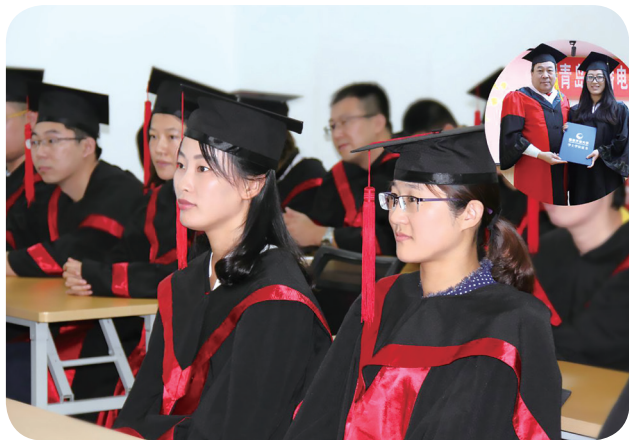
开放教育学生参加学位授予仪式

起步就是高起点。依托40多年办学经验，全新出发的青岛开放大学早已“功名加身”——走出了“先进传播手段+名师名教”的发展之路，探索了开放教育的实现路径，积累了终身教育的办学经验，成为青岛市开