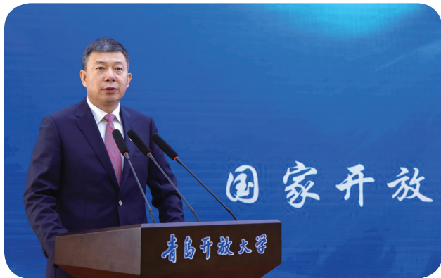
国家开放大学党委书记、校长荆德刚讲话

据悉，中共青岛市委十二届八次全体会议部署“高水平建设青岛开放大学”任务后，青岛广播电视大学以攻山头炸碉堡的决心狠抓落实，同步推进上报审批和建设方案编制工作，两个月之内青岛开放大学揭牌成立。这是落实市委部署的第一步，也是我市构建服务全民终身学习教育体系的重要一步。青岛开放大学将主动适应数字化、智能化、终身化、融合化教育发展趋势，建设青岛市终身教育的主要平台、在线教育的主要平台，灵活教育的平台、对外合作的平台，成为青岛服务全民终身学习的重要力量、技能社会的有力支撑、教育领域对外开放合作的新高地。