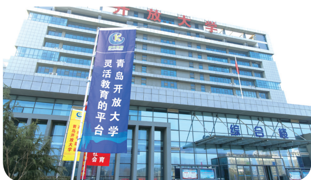
青岛广播电视大学正式更名为青岛开放大学

青岛晚报 2020年12月22日 12月22日上午，青岛开放大学正式揭牌成立。这意味着，有着41年辉煌战绩的青岛广播电视大学正式落幕，更新迭代成为服务青岛市民终身学习、推进青岛开放教育和社区教育体系建设的“互联网+”新型大学——青岛开放大学。记者从揭牌仪式现场了解到，这所曾经弥补两代人“学历缺憾”、走出30万高素质人才、对青岛市人力资源贡献最大的大学，加冕“青岛开放大学”后，将整装再出发，作为青岛“互联网+”教育的“国家队”成员，瞄准青岛在线教育“排头兵”这一目标，打造构建服务全民终身学习的教育体系的“青岛样板”。