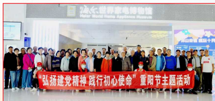
“花香漾端午 真情系开大”青岛开放大学2021年度退休教职工端午节活动