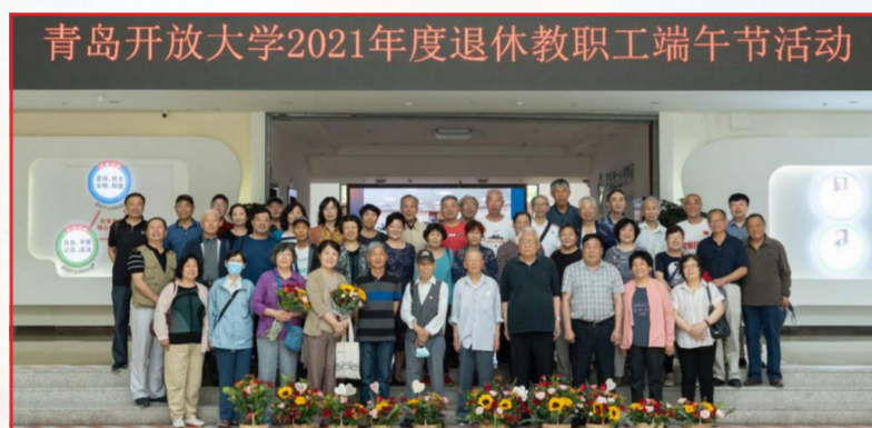
“弘扬建党精神 践行初心使命”老干部重阳节活动