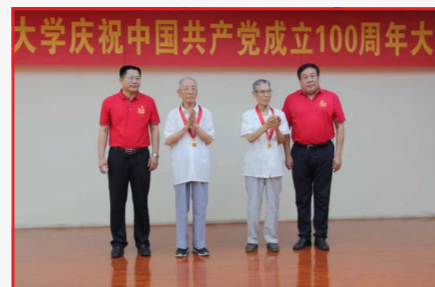
我校为老党员代表颁发“光荣在党五十年”纪念章

本报讯 为深入学习贯彻习近平总书记关于老干部工作的重要指示要求，广泛开展喜迎党的二十大和学习宣传贯彻党的二十大精神系列活动，今年4月份以来，市委老干部局在市直单位开展了新时代老干部工作高质量发展优秀品牌创建活动。我校高度重视、精心培育，申报的老干部工作品牌“创开银辉”在全市70余家申报单位中脱颖而出，入围2022年度市直单位老干部工作高质量发展优秀品牌，并编入《奋进新征程 建功新时代——青岛市市直单位老干部工作高质量发展优秀品牌展示》手册。