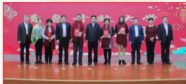
“不忘初心，薪火相传 而今荣休，嘉惠弥长” 青岛开放大学荣休仪式