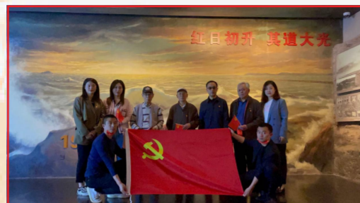
我校老干部党支部开展“回眸红色历史 重温光辉岁月”主题党日